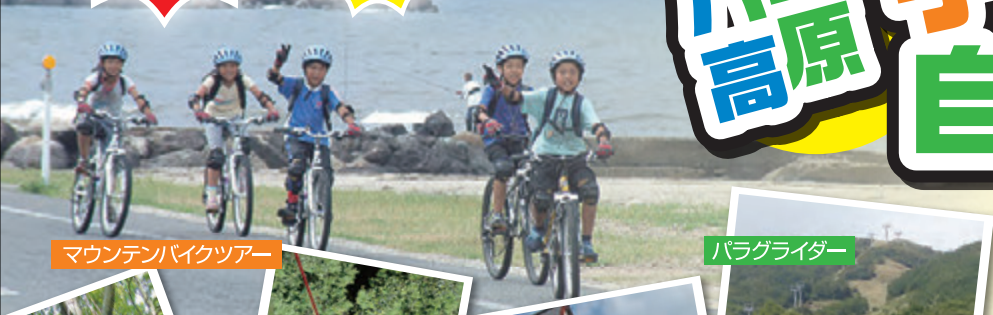
マウンテンバイクツアー