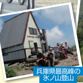
兵庫県最高峰の 氷ノ山登山