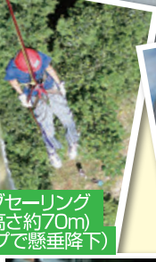
アブセーリング (高さ約70m) (ロープで懸垂降下)