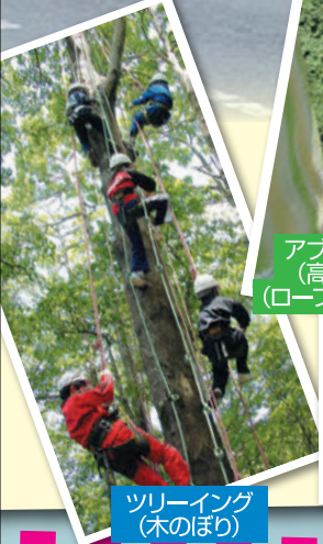
ツリーイング (木のぼり)