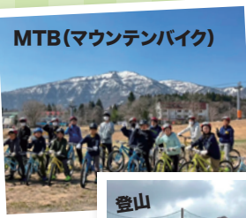
MTB(マウンテンバイク)