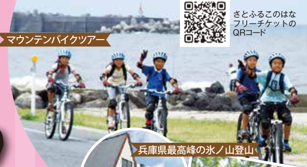
兵庫県最高峰の氷ノ山登山